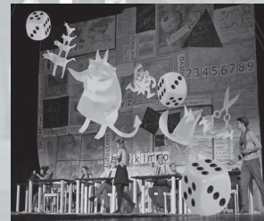
LEICHTERALS LUFT CH-Aarau 2014