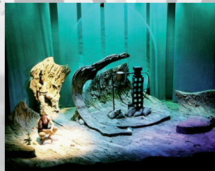
SAND Off-Broadway NYC 2008

Schöpfend aus meinem umfangreichen internationalen Erfahrungsschatz als Kunst und Kultur Vermittlerin, Gestalterin des Spiels, Kostüms- und Raums, habe ich es immer als Herausforderung verstanden Inszenierungen zur Stärkung von interkultureller Sozialkompetenz und Kommunikationsfähigkeit im Handlungsspektrum für Menschen zu begreifen: Im Übersetzen von narrativen Strukturen in erlebnisreiche Mitmach-Räume inszeniere ich für Sie emotionale Welten.